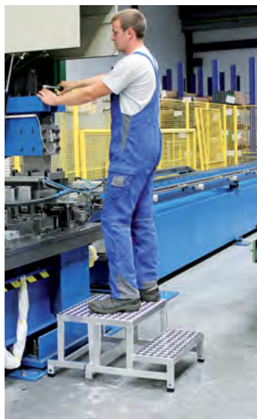
Abb. Bestell-Nr. 50410 und Bestell-Nr. 50411